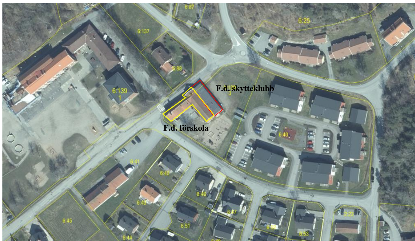
Figur 1. Röd markering avser den f.d. skytteklubben och gul markering avser den f.d. förskolan.

En del av byggnaden har tidigare använts av en skytteklubb och en del av byggnaden har sen tidigt 90-tal och fram till 2019 använts som förskola. Inför omställningen till förskola/ fritids utfördes en större ombyggnation och det syns inga spår av den f.d. skofabrikens verksamhet, se figur 1 och 2. Idag används inte byggnaden utan står tom.